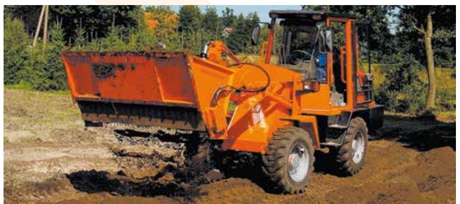
Verteilen von Mutterboden für spätere Bepflanzung