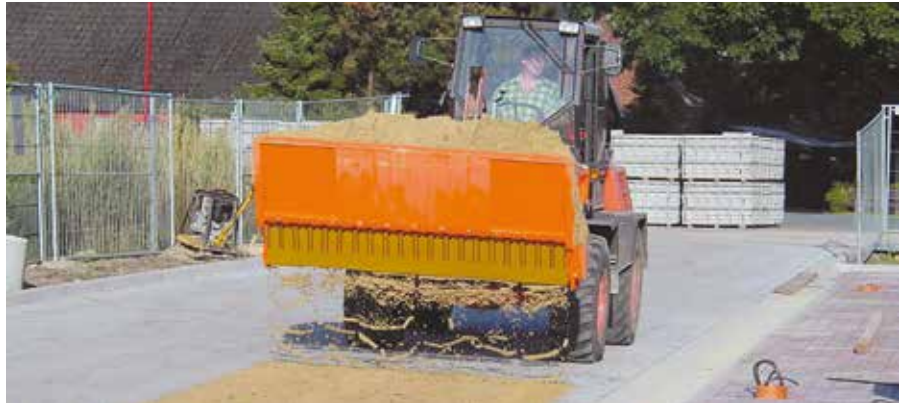
Einsanden der frisch verlegten Pflasterfläche.