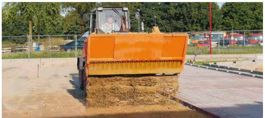
Auftragen von Material zur Erstellung des Feinplanums.