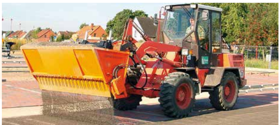
Auffüllen von ökologischen Pflastersystemen mit Splitt.